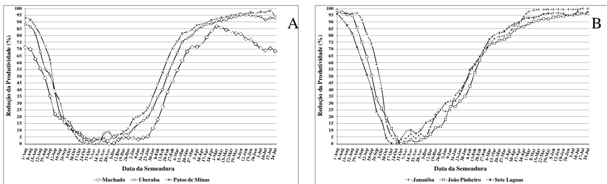
Figura 2: Redução da produtividade de grãos de milho em relação ao valor médio máximo histórico, para diferentes datas de semeadura em regime de sequeiro, nos municípios de Machado, Uberaba e Patos de Minas (A) e Janaúba, João Pinheiro e Sete Lagoas (B), MG.